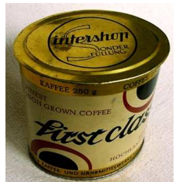
Kaffeedose first class Feinster Hochlandkaffee intershop Sonderfüllung VEB Kaffee- und Nahrungsmittelwerke Halle/Saale.

brauchte freikonvertierbare Währung. Also Geld, für das man auch im Ausland einkaufen konnte. Wer damals in den sozialistischen Bruderländern war wird wissen, dass es für DDR-Mark nichts gab. Sogar der Umtausch war beschränkt. Deshalb blühte der Handel mit Bettwäsche und ähnlichem. Um aber an Devisen zu kommen, gründete der Staat 1962 Intershopläden, in denen gegen Westgeld jeglicher Herkunft Waren angeboten wurden, natürlich westliche. Käufer waren nur Westdeutsche und Ausländer, denn bis 1974 durften Einheimische keine Devisen besitzen. Wer Verwandte hatte, die ihm DM zukommen ließen, durfte nun auch im Intershop einkaufen. Ab April 1979 konnte nicht mehr mit DM bezahlt werden, sondern mit den sogenannten Forumschecks (eine Forumscheck-Mark entsprach einer DM), die in der Staatsbank eingetauscht werden mussten. Bei den Waren handelte es sich oft um „Gestaltungsprodukte“, das waren Dinge, die hier im Land für Westfirmen hergestellt wurden. Dadurch konnte es passieren, dass ein Arbeiter, dessen Tan