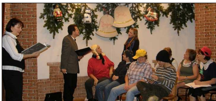
Es durfte gelacht werden bei der Aufführung der Rodauer Theatergruppe.

Bewerbungen an die Gemeinde Leubnitz, Am Park 1, 08539 Leubnitz, Tel. 037431 / 3424.