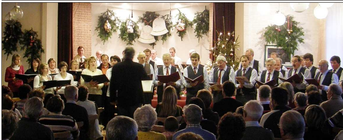
Vereinigung der Stimmen des Rodauer Kirchenchores mit dem Rodauer Männerchor.