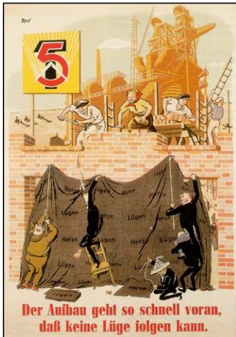
Die DDR feiert mit dem Plakat in den 1950er Jahren den Wiederaufbau der Industrie unter dem ersten Fünfjahrplan und verbindet dies mit Propaganda gegen Westdeutschland.

Die Auswertung der durchaus beachtlichen Ergebnisse in der Erfassung von Küchenabfällen zeigt eine größere Differenziertheit im Pro-Kopf-Aufkommen zwischen den Kreisen des Bezirkes und macht damit Reserven deutlich. Im Durchschnitt des Bezirkes wurden im 1. Halbjahr 50 kg Küchenabfälle pro Haushalt erfaßt. Die besten Ergebnisse wurden in den Kreisen Oelsnitz, Reichenbach und Stollberg mit über 60 kg erzielt. Wir bitten Sie deshalb, das Erfassungsergebnis Ihres Ortes und kreisliche Vergleiche gründlich auszuwerten und gemeinsam mit den Ausschüssen der Nationalen Front, den LPG und den Sparten des VKSK weitere Maßnahmen einzuleiten, um diese wertvollen Futtermittel vollständig zu erfassen und in Fleisch für die Versorgung der Bevölkerung umwandeln zu helfen.