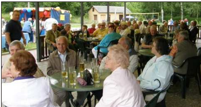
Badfestbesucher auf der Terrasse des Bades.

Der Erlös des Festes kommt wiederum der Betreuung dieser Einrichtung zugute. Viele Einwohner und Firmen der Umgebung beteiligten sich hierbei mit Sachspenden. B.M.