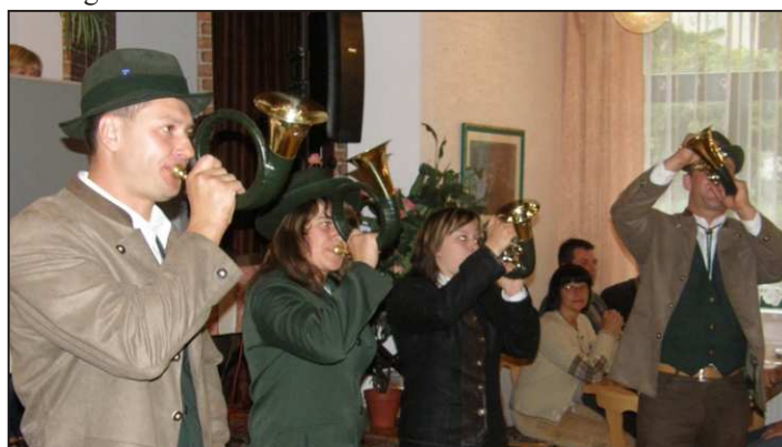
Die Krebeser Jagdhornbläser.