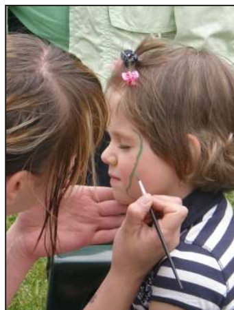
Begeisterung beim Kinderschminken