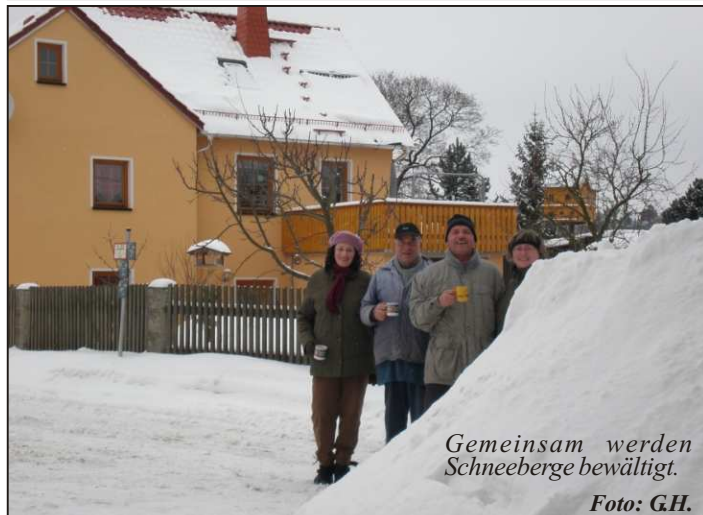
Gemeinsam werden Schneeberge bewältigt.